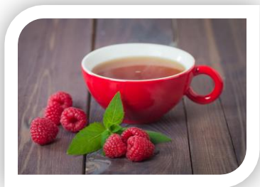
El té de hoja de frambuesa puede ayudar con los calambres.