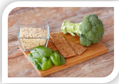
Consuma alimentos ricos en fibra para prevenir o disminuir el estreñimiento.