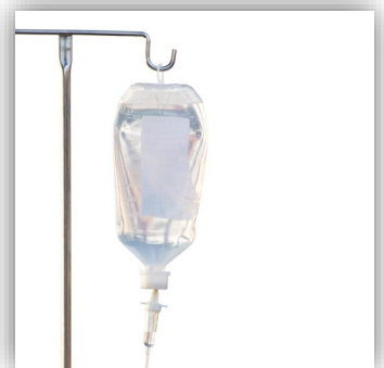
Quý vị nhận Oxytocin qua dịch truyền vào tĩnh mạch.